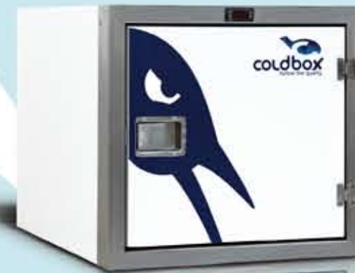
Smart 200 Lt