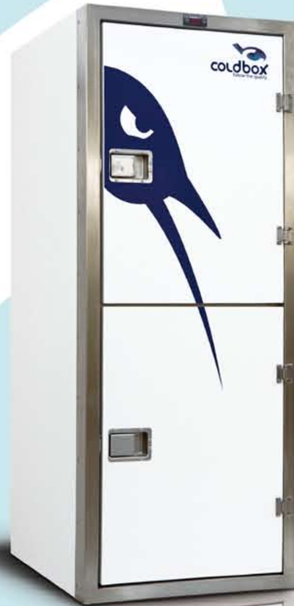
Smart 620 Lt 2p

ÉQUIPEMENT: 110/220 Vac câble; 5 mt de câblage basse tension; grilles de séparations.