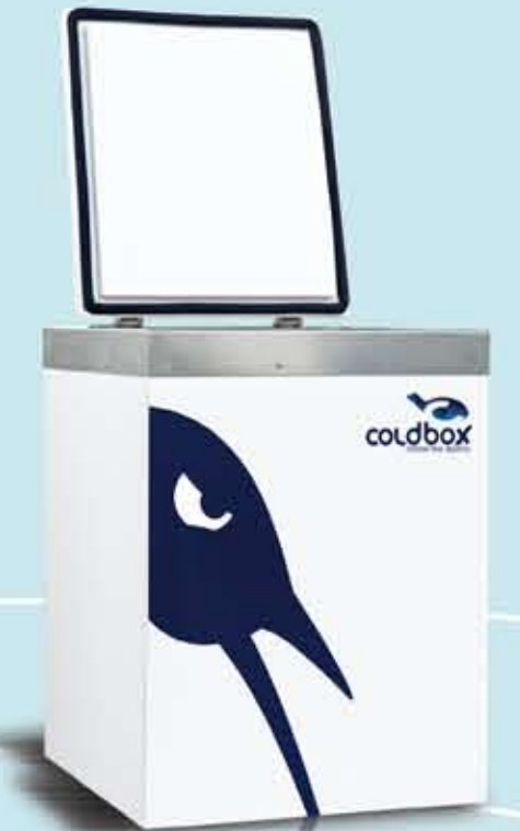
Smart 200 Lt p