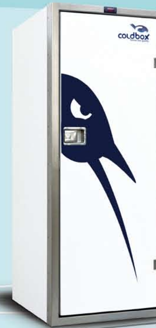
Smart 620 Lt 1p