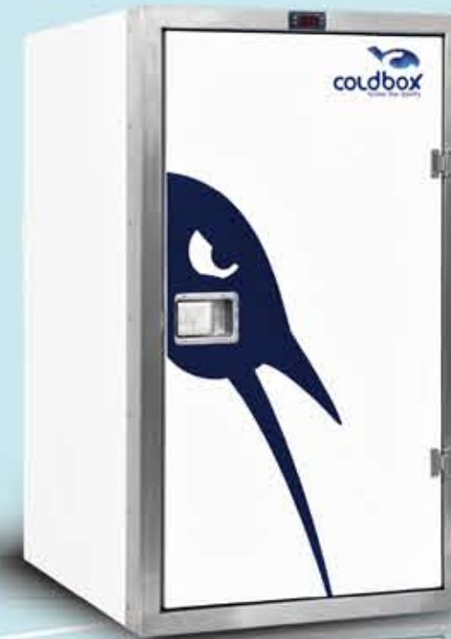
Smart 410 Lt