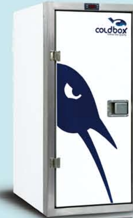
Smart 306 Lt